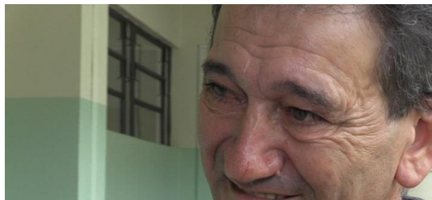
Professor decidiu que queria ensinar outros alunos do EJA, em Toledo

O Colégio Estadual Irmão Germano Rhoden de Toledo, onde Almeida trabalhava, conta com 700 alunos no programa de Educação de Jovens e Adultos. "Venha em uma sala de Educação de Jovens e Adultos. Se você não comprovar isso que estou lhe falando, onde você vai encontrar um ambiente cooperativo entre os colegas e professores acolhedores, pode falar com o Ivanor, porque ele mentiu", afirmou o professor.